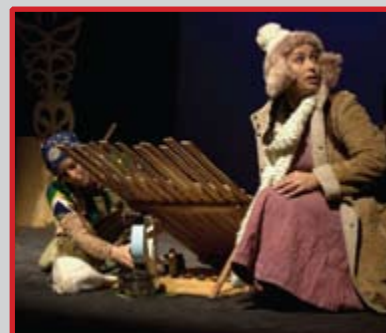
Fot. Materiały Teatru Dzieci Zagłębia ze spektaklu „Brzydkie kaczątko”.